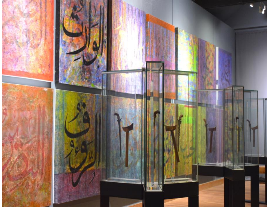
Gambar 13: Galeri Kehambaan, Muzium Sultan Abu Bakar memaparkan konsep permuziuman yang berbeza dengan ilmu permuziuman kolonial