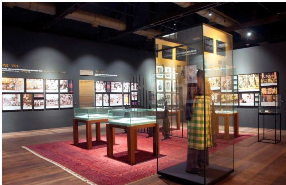
Gambar 10: Galeri Kesultanan Melayu Pahang, Muzium Sultan Abu Bakar, Pahang