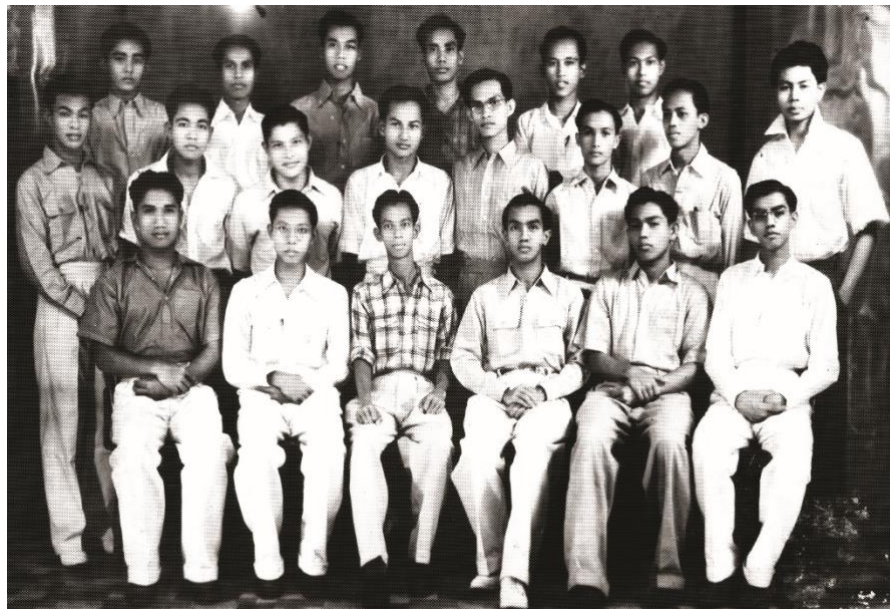
Gambar 2: Sultan Ahmad Shah Pahang, duduk nombor 2 dari kiri ketika belajar di Kolej Melayu Kuala Kangsar