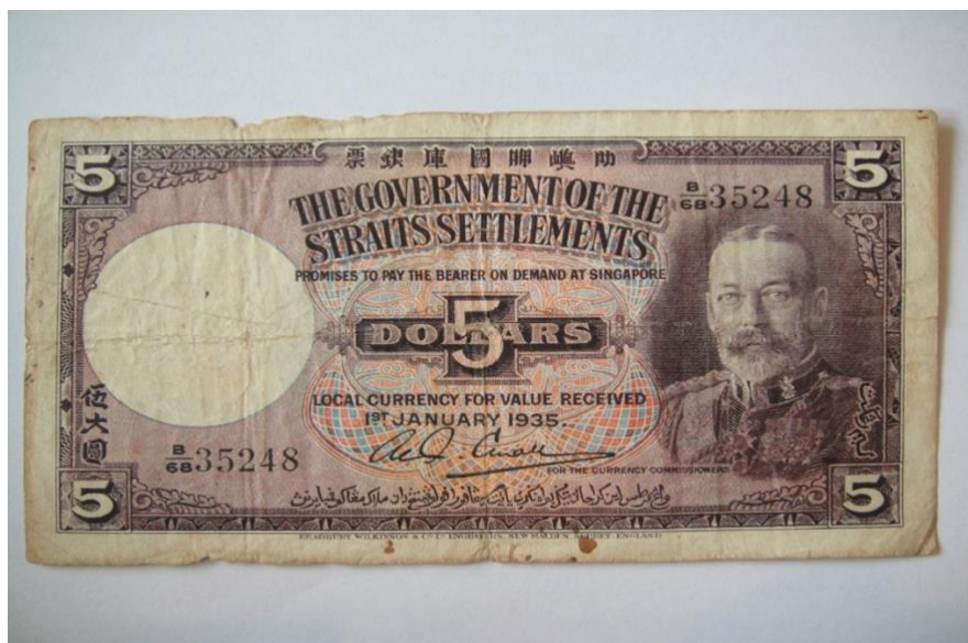
Gambar 16: Wang Dollar Negeri-negeri Selat