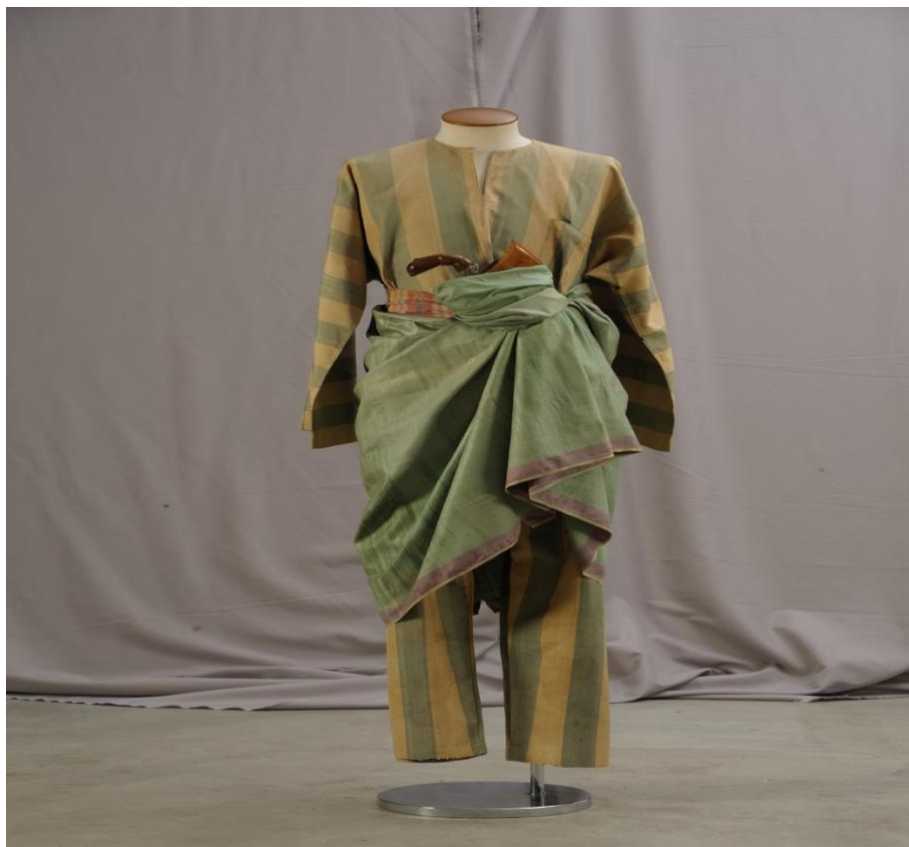
Gambar 12: Pakaian Melayu Pahang menggunakan kain tenun Pahang berserta kaedah pemakaian busana Melayu