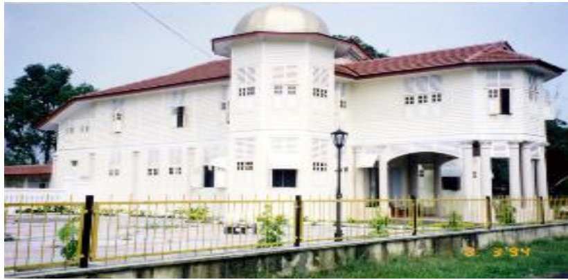
Gambar 3: Istana Leban Tunggal yang dibina pada tahun 1935