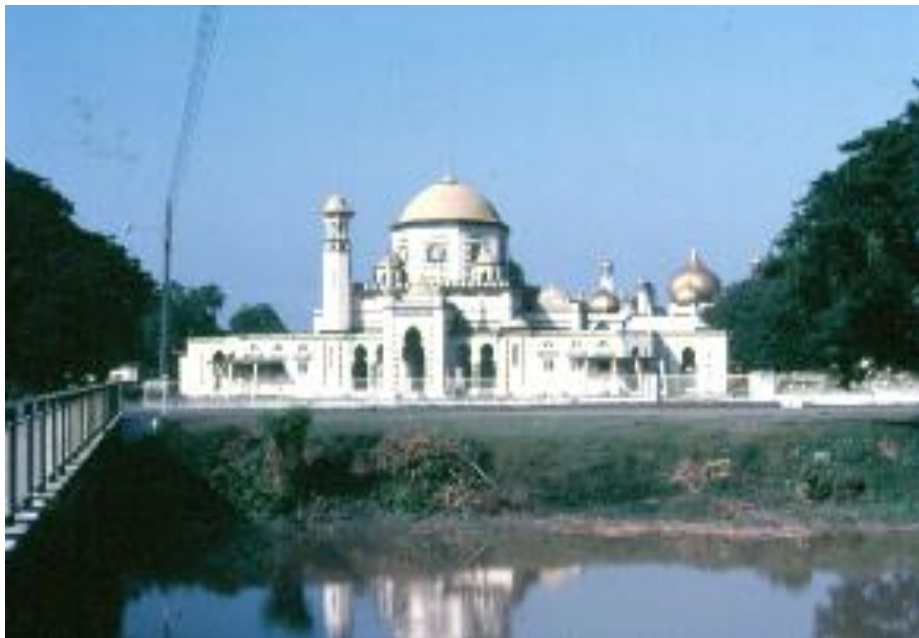
Gambar 15: Masjid Abdullah ini dibina pada tahun 1929