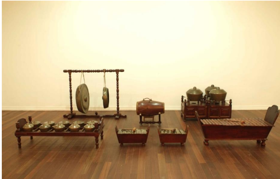
Gambar 11: Gamelan Melayu di Muzium Sultan Abu Bakar