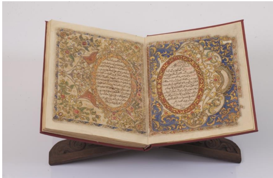
Gambar 14: Hukum Kanun Pahang