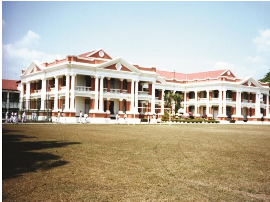
Gambar 1: Malay College Kuala Kangsar (MCKK) dibina oleh British pada tahun 1905