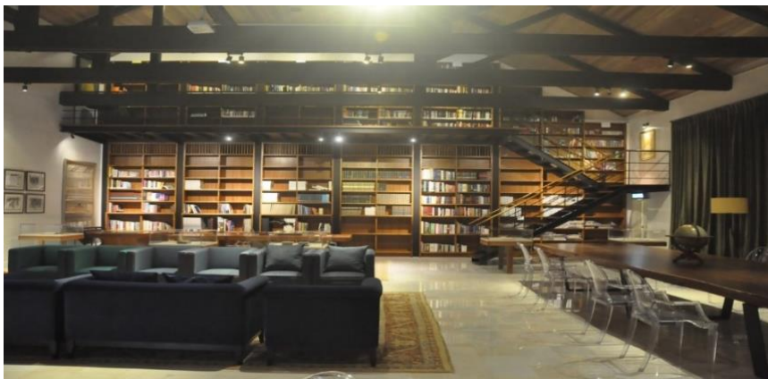
Gambar 4: Perpustakaan Diraja atau Khutubkhanah di Kuantan, Pahang