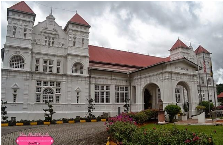
Gambar 17: Muzium Perak yang dibina secara rasminya pada 1 Januari 1883

Maxwell Hill (kini dikenali sebagai Bukit Larut) di Taiping telah dilantik sebagai kurator pertama Muzium Perak ini untuk mengumpul spesimen alam semulajadi dan etnologi tempatan sebagai koleksi awal muzium tersebut.