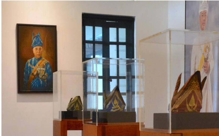
Gambar 9: Galeri Istana Sebagai Institusi Intelektual Awal Melayu, Muzium Sultan Abu Bakar, Pahang