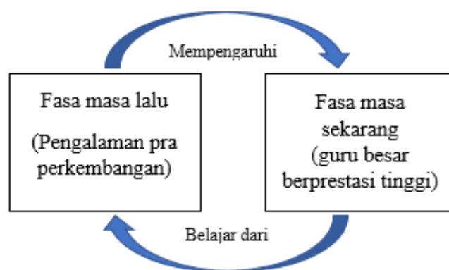
Rajah 1. Kerangka teoritikal kajian. Adaptasi daripada Model Garisan Masa Pemimpin Mostovicz et al. (2009)

Kajian ini dijalankan berdasarkan Model Garisan Masa Pemimpin (Mostovicz et al., 2009) yang digunakan sebagai kerangka teoritikal kajian. Model Garisan Masa Pemimpin menjelaskan tentang peringkat perkembangan pemimpin iaitu masa lalu, masa sekarang dan masa depan. Model ini menjelaskan fasa masa lalu yang bermaksud diri pemimpin pada masa lalu dan ciri-ciri yang diperlukan sebagai pemimpin. Fasa masa sekarang menjelaskan persekitaran semasa pemimpin bertindak dan fasa masa depan menjelaskan arah tujuan yang perlu dicapai. Dalam kajian ini, pengkaji hanya memberikan fokus kepada perkembangan pemimpin pada masa lalu atau dikenali sebagai pengalaman pra perkembangan yang menjadi pemangkin kewujudan guru besar berprestasi tinggi.