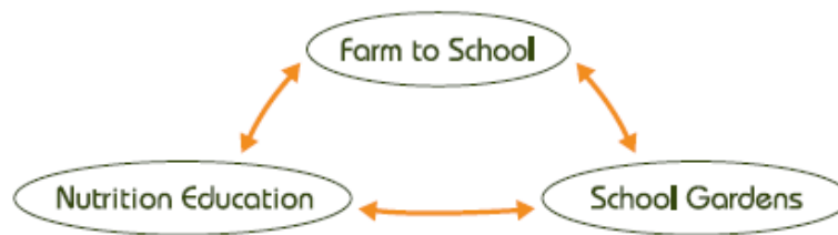
Rajah 1. Konsep integrasi pendidikan pemakanan dan taman sekolah

Got veggies? Program merupakan sebuah kurikulum pendidikan pemakanan berasaskan taman yang dibangunkan dengan matlamat meningkatkan pengambilan buah-buahan dan sayur-sayuran berkhasiat dalam kalangan kanak-kanak. Kurikulum ini dibangunkan khas untuk murid-murid gred 2 dan gred 3 dan mempunyai rancangan mengajar yang selari dengan Wisconsin Model Academic Standard . Aktiviti pembelajaran bagi kurikulum ini sesuai untuk murid-murid sekolah rendah. Kurikulum pendidikan pemakanan berasaskan taman merangkumi aktiviti berasaskan taman, menyediakan resepi dan memasak dan makan di taman tersebut. Kurikulum ini menyediakan strategi yang ideal untuk mendidik dan menggalakkan minat dalam pengambilan buah-buahan dan sayuran yang segar. Ia merupakan satu program komprehensif bagi integrasi pemakanan berkhasiat dan juga kemahiran penanaman di sekolah.