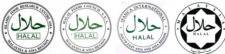
Rajah 1: Contoh Logo Halal di Malaysia

Pensijilan halal yang diperolehi ini membolehkan penggunaan logo halal pihak berautoriti tersebut dipaparkan di atas produk atau di premis pemohon. Penggunaan logo halal hanya dibenarkan kepada pemohon yang telah mendapat pensijilan halal daripada badan-badan tersebut sahaja. 26 Pensijilan halal ini berasaskan Hukum Syarak dan tujuan utamanya adalah untuk memberi keyakinan kepada pengguna Islam mengenai status halal sesuatu produk baik berupa makanan atau lain-lainnya. Pensijilan halal juga untuk memenuhi budaya pengguna yang mahukan produk yang memberi kesan kesihatan, 27 selamat dan berkualiti. Selain itu ianya sebagai satu nilai komersial perdagangan iaitu “marketing tools” 28 untuk meraih pasaran dalam dan luar negara kerana permintaan ke atas produk-produk halal 29 meningkat seiring dengan peningkatan pengguna Islam di dunia. Logo halal juga memainkan peranan penting untuk memastikan bahawa kualiti halal terjamin. 30